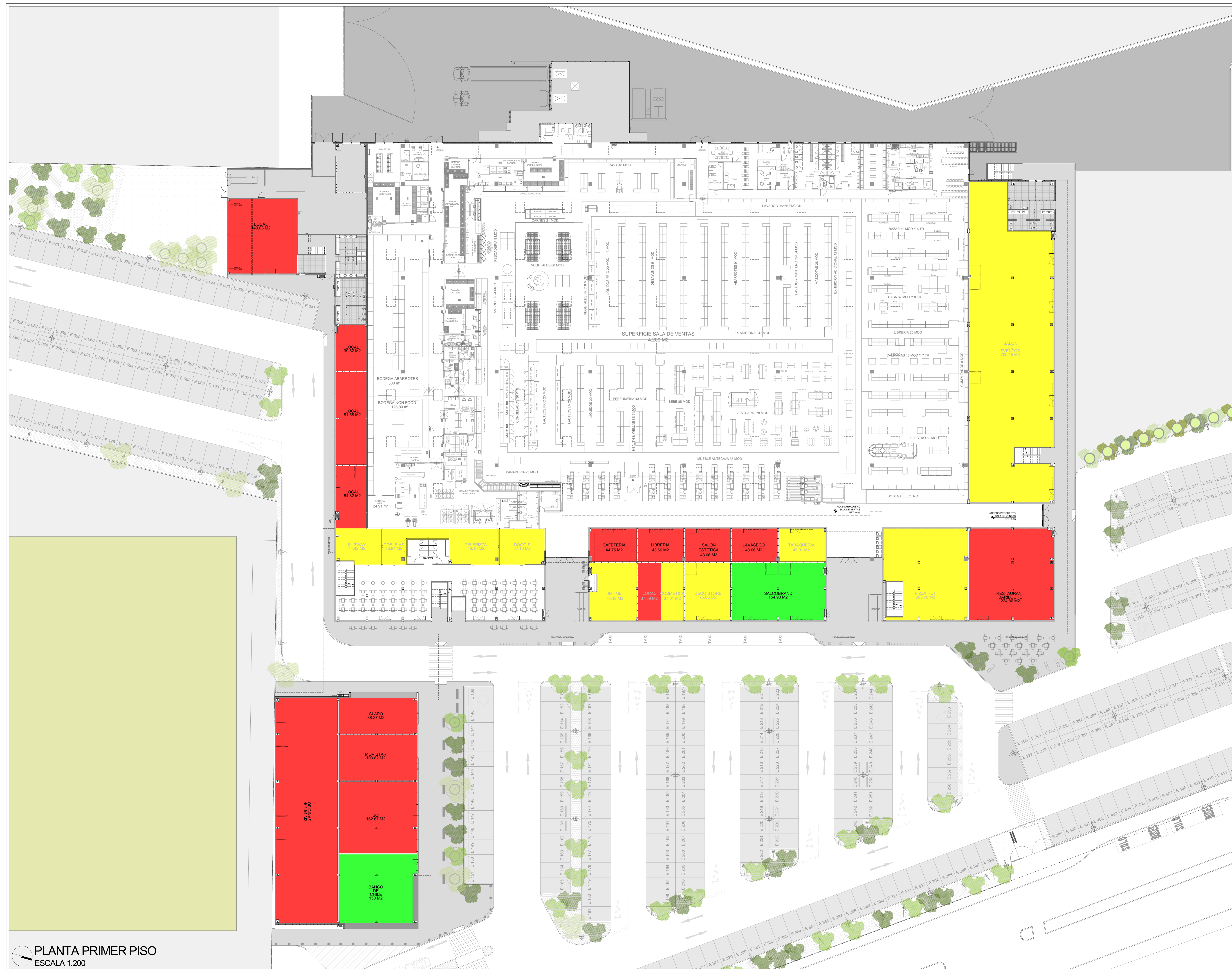
PLANTA PRIMER PISO ESCALA 1.200